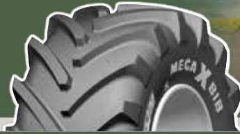
Pressione (bar) e (psi) - Carico per pneumatico in kg (4)